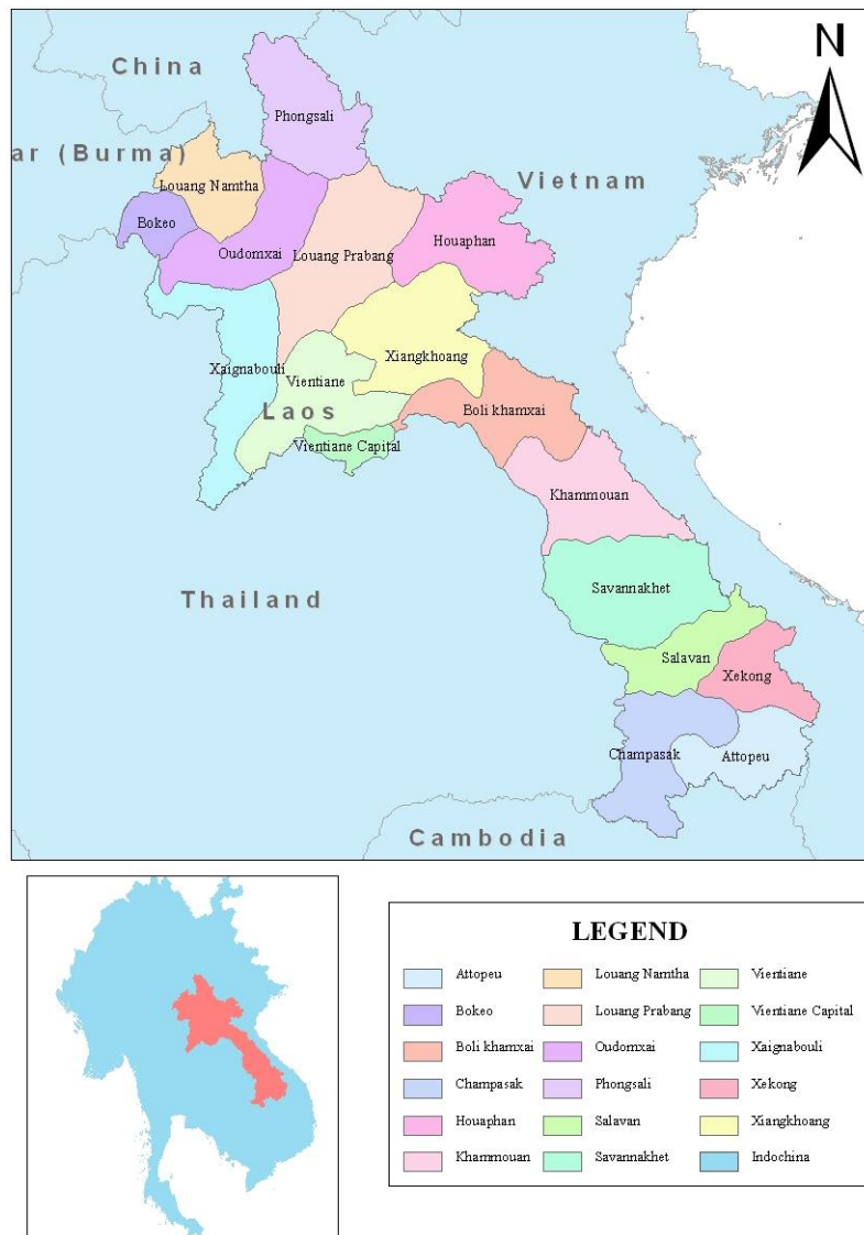
รูปภาพที่ 1.2 : แผนที่แสดงถึงแขวงต่างๆ ในสปป.ลาว