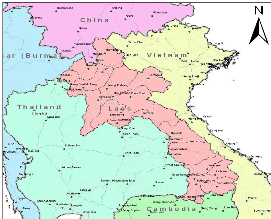
รูปภาพที่ 1.1 : แผนที่ที่ตั้งของสปป.ลาว