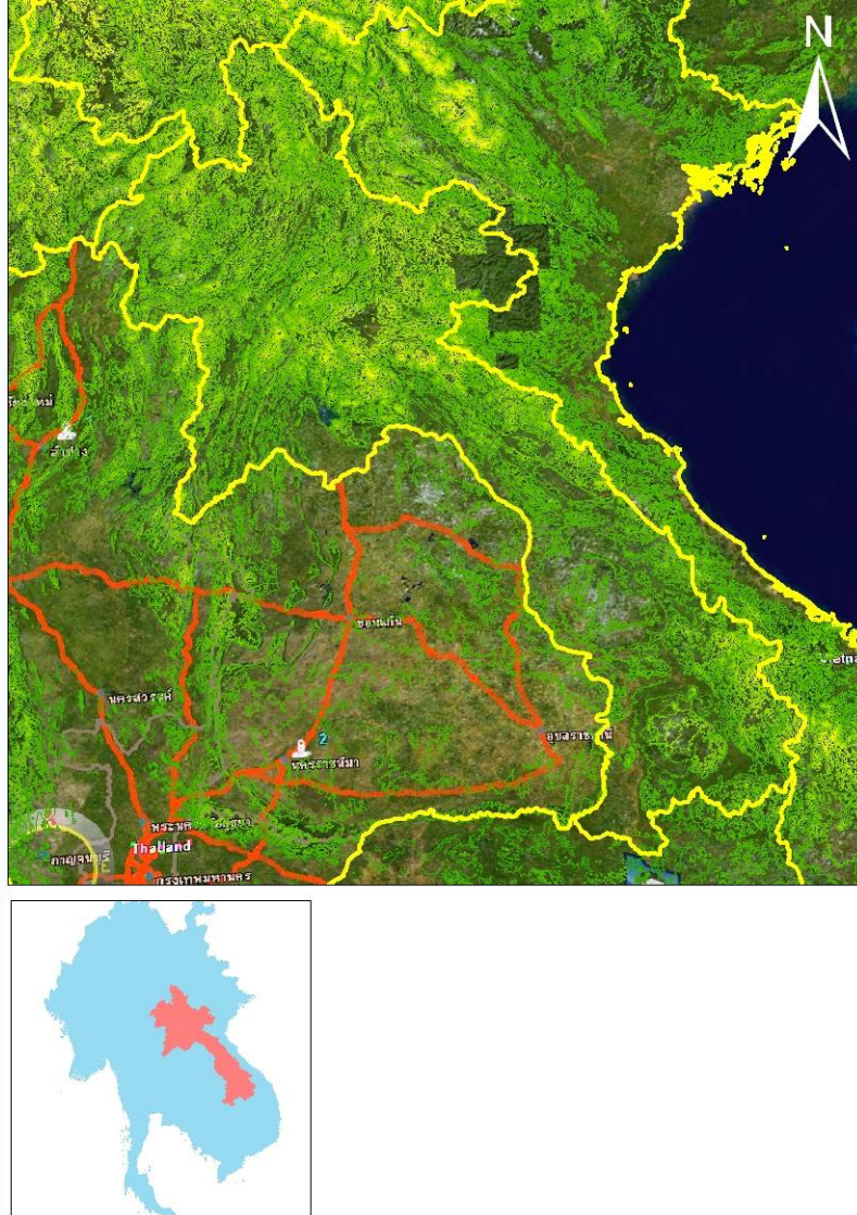
รูปภาพที่ 1.3 : แสดงชั้นความสูงของสปป.ลาว

ลาวเป็นประเทศที่ไม่ติดกับทะเล ส่วนใหญ่เป็นภูเขาและที่ราบสูงมีภูเขาล้อมรอบ พื้นที่ราบมีเพียง 20% ซึ่งส่วนใหญ่อยู่ทางตอนกลางของประเทศ ปกคลุมไปด้วยป่าอันหนาทึบ โดยเฉพาะทางตอนเหนือมีความสูงเฉลี่ยเกิน 900 เมตร และมียอดเขาสูงที่สุดว่า ภูเขีย้ 2.817 เมตร มีแม่น้ำไหล